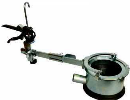
FLEIKA Bohrsäulenabstützungen FLEIKA Wassersammelringe mit und ohne Spanngriff, für KB 160 und KB 250

Diverses Diamantwerkzeug-Zubehör kurzfristig lieferbar !