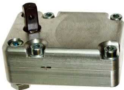
FLEIKA Übersetzungsgetriebe 1 : 2,6