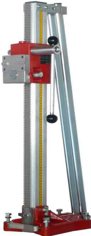
Spannhalsaufnahme Ø 60 mm. zur Befestigung von Freihandmaschinen.